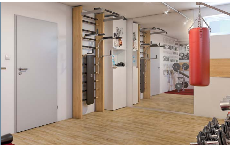
Metall BASIC, Mausgrau (RAL 7035)

Kostengünstige Lösung unter Beibehaltung der Hochleistung vom Nutzparameter. Die Konstruktion aus verzinktem Stahl garantiert Langlebigkeit und Zuverlässigkeit.